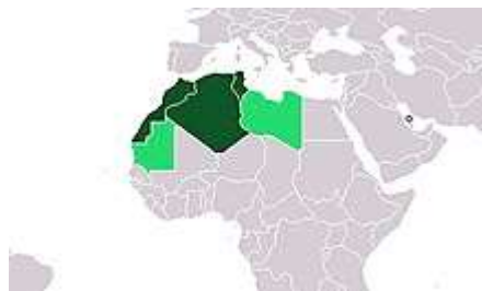
1Estados del Magreb en sentido amplio: Marruecos, Sáhara Occidental, Argelia, Túnez, Libia.

Por consiguiente, el número de refugiados expresa claramente la gravedad del conflicto, número que va aumentando con cada nuevo brote de violencia.